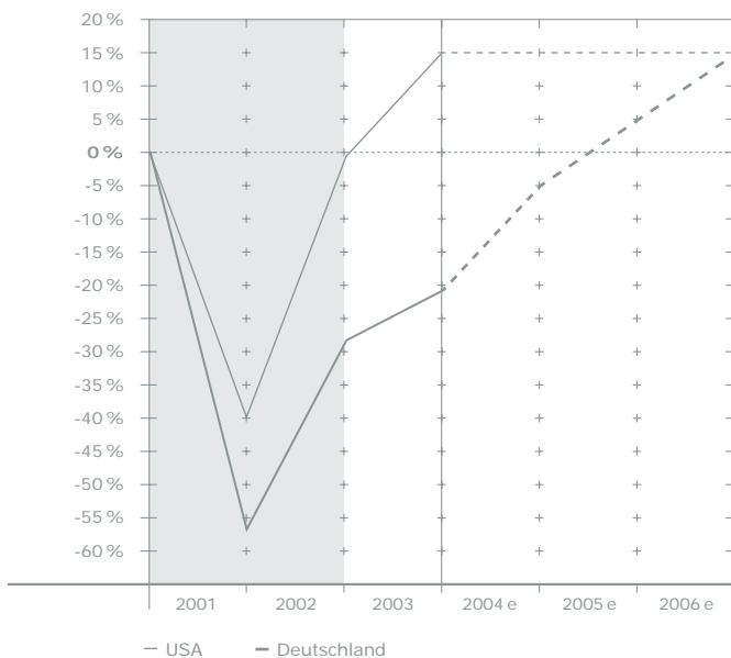
Abb. 1: Markteinbruch und Markterholung Deutschland vs. USA

Entwicklung des Umsatzvolumens der Top-20-Interactive-Dienstleister in den USA und in Deutschland (New Media Service Ranking 2004)